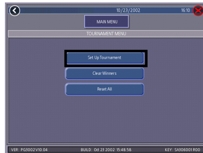
FIGURE 2 - TOURNAMENT MENU SCREEN