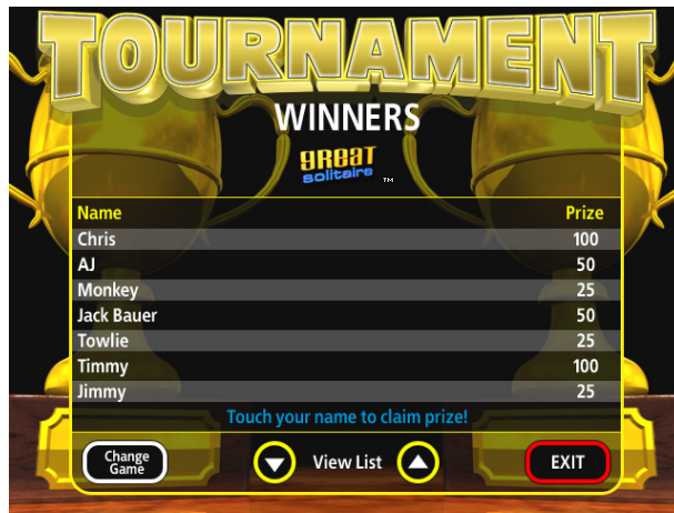
FIGURE 5--WINNERS' SCREEN