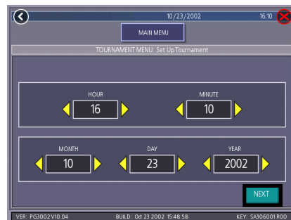
FIGURE 3 - TOURNAMENT CLOCK